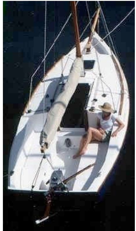
コクピット後端のウエルに船外機を備える。