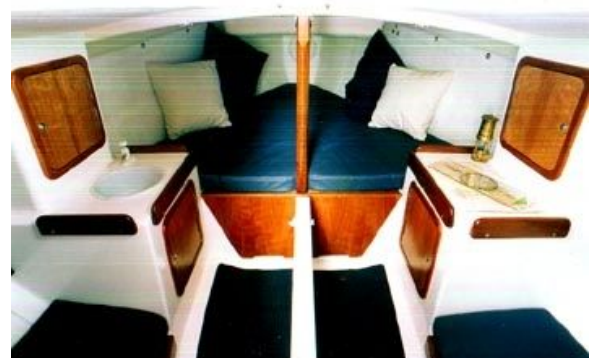
4名のバースを持つ居心地の良いキャビン。