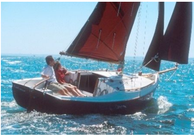
あらゆる風域に対応しやすいカッターリグ。