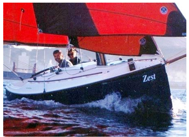
艇体にある段差でスプレーをきれいにさばいている。