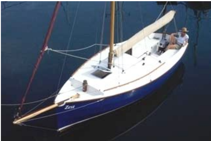
存在感あふれるスタイルは、19フターと思わせない。