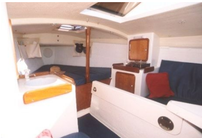
シッティングヘッドルームは十分にあり、キャビントップは持ち上がる。